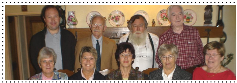
Foto van het voltallig bestuur (van L naar R. boven en onder).